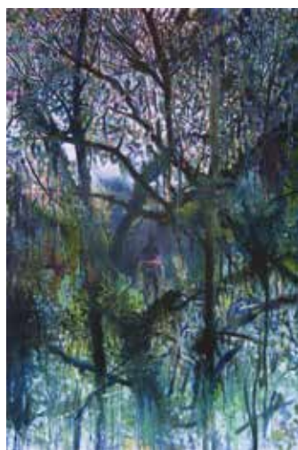
Jean-Philippe Brunaud Sans titre