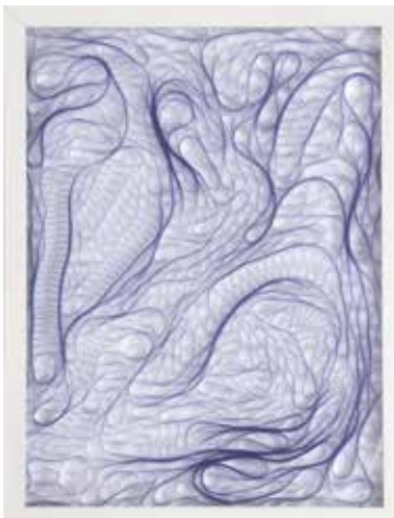
Olivier Michel Zone de turbulence n° 14