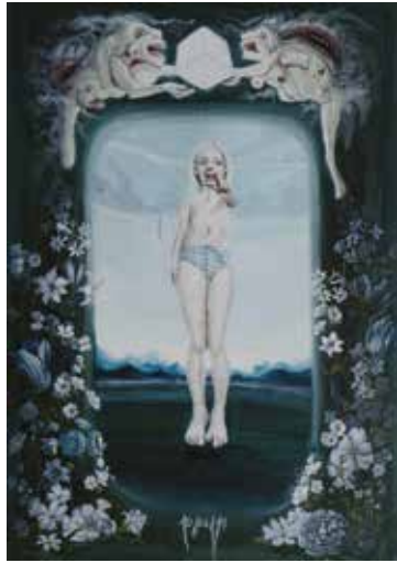
Raphaëlle de Gastines 10/04/2017

14>19 novembre 2017 Bastille Design Center