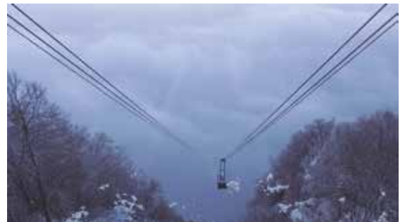
Audoynaud & Zambon Un jour bleu en sommeil