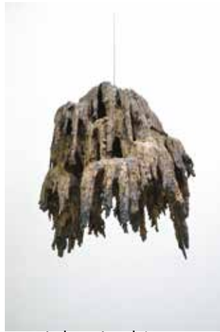
Jules Andrieu Primäre Spannungen - (Ge) Dichte / Tropfstein Bronze