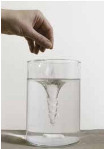
Fabrice Leroux Vortex