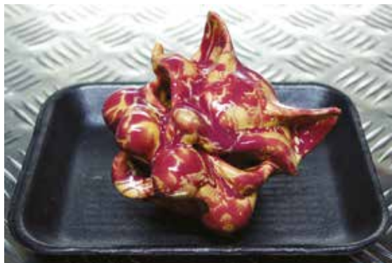
JPRV Nature morte

14>19 novembre 2017 Bastille Design Center