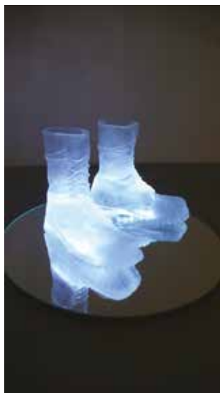
Sophie Urbani Je crois que j'ai marché sur la Lune