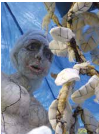
Anne Bothuon Paysage intérieur