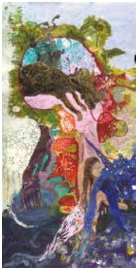
Nathalie Salé Grand foisonnant