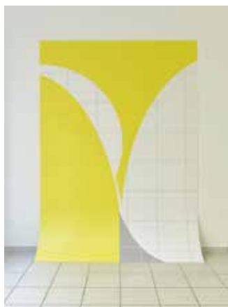
Soizic Stokvis Perspectives