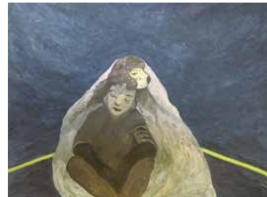
Charlotte Puertas Embarcation 1