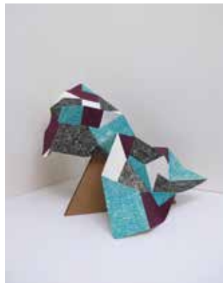
Elodie Boutry Beyond the line