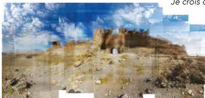
Ze Wei Ani, Série I - Porte du Lion,