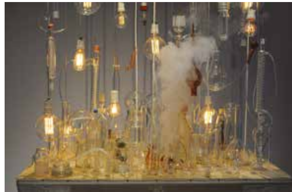
Hélène Launois Hypothèse provisoire