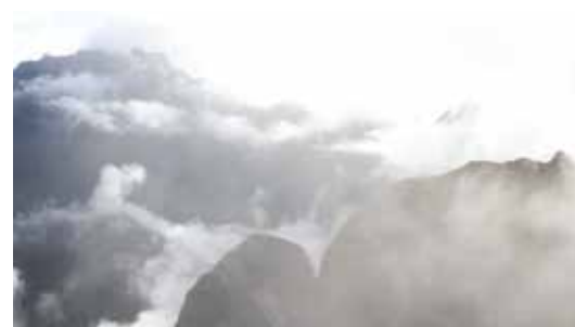
Aliénor Vallet Les montagnes invisibles