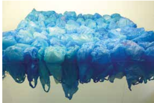
Julie Maret Polymères