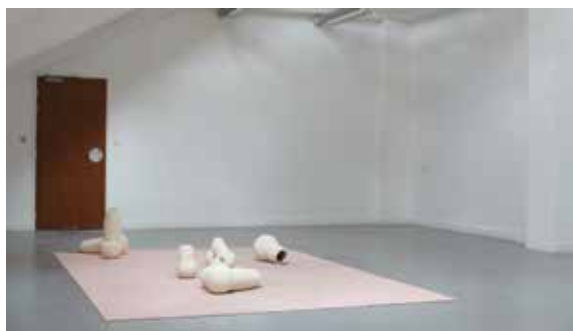
Charlotte Gunsett Un moment de chahutement